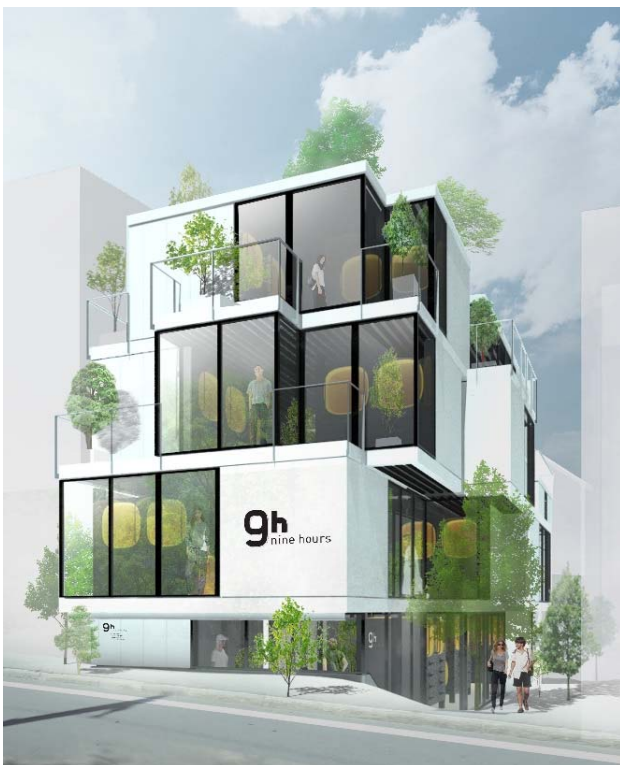
「ナインアワーズ赤坂」外観（イメージ）