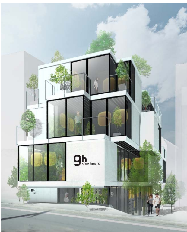
「ナインアワーズ赤坂」外観（イメージ）