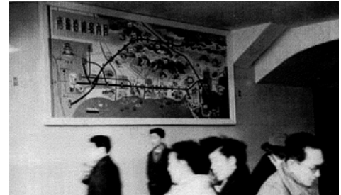
掲出していたころの南海沿線案内図

平成28年まで汐見橋駅で掲げられていた「沿線観光案内図」と同時代の制作と思われる、難波駅に掲出していた看板「南海沿線案内図」を特別公開します。かつての天王寺支線や北島支線などの路線をはじめ、堺水族館など懐かしい南海沿線の名所や旧跡を紹介しています。