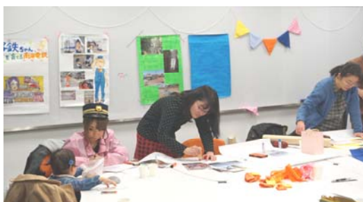
展示物などの制作風景