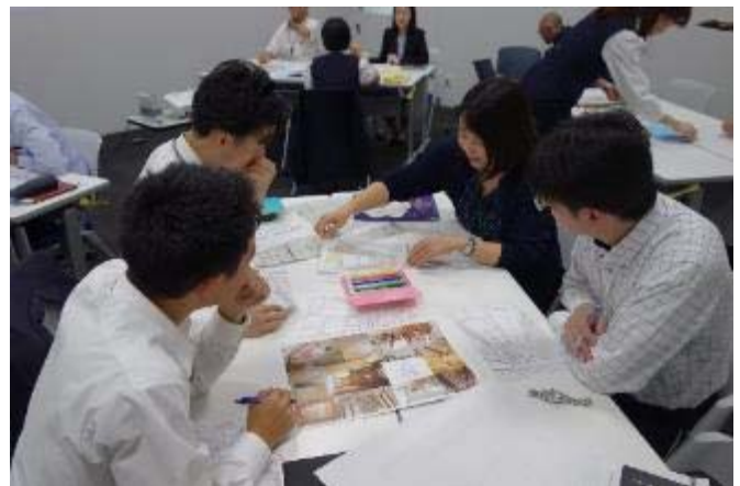
社内メンバーのデザイン策定の様子