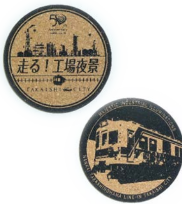
ヘッドマークコースター（イメージ）