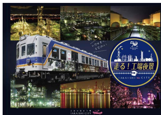
鉄道コレクション 南海2200系「走る！工場夜景」パッケージデザイン（イメージ）