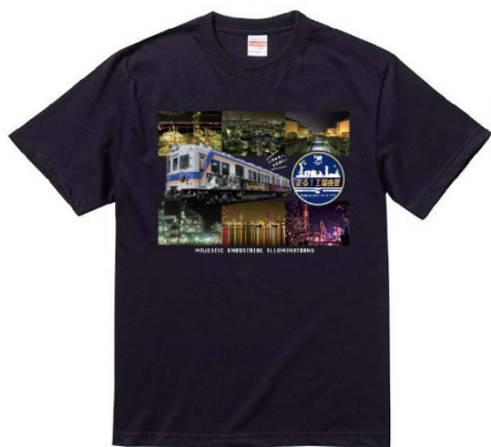
Tシャツ（表面イメージ）