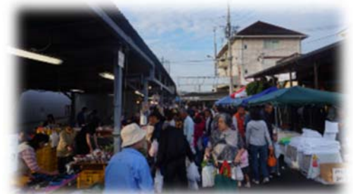
田尻漁港日曜朝市の様子

田尻漁業協同組合では、毎週日曜日の朝（7:00～12:00）に朝市を開催しています。うまいもん祭当日も開催しますので、あわせてお楽しみください。