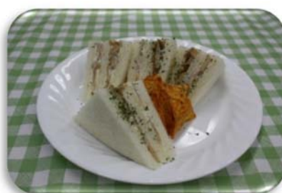
たけのこサンドウィッチ