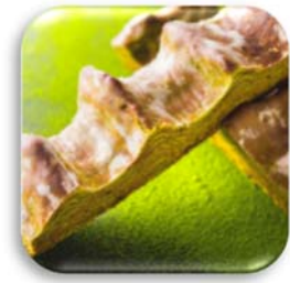
カットバウム（抹茶味）