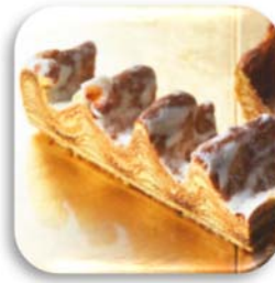
カットバウム（和三盆味）