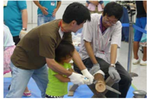
昨年のエコワークショップの様子