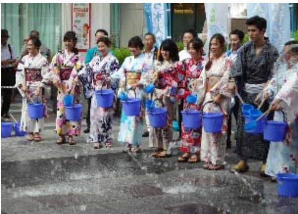
留学生による、昨年の浴衣・打ち水体験の様子

※セレモニー終了後、一部企業および団体が各実施場所（次ページ参照）で打ち水を開始します。