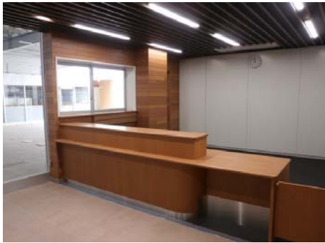
係員窓口（オープンカウンター）