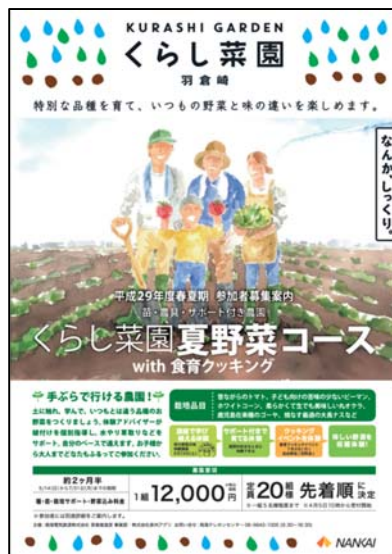
くらし菜園募集チラシ