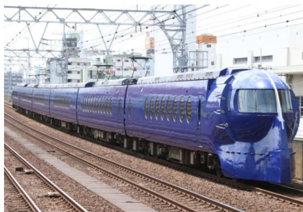
南海電鉄が運行するラピート

「成田・関西 スカイライナー&ラピートきっぷ」は、2015年12月より発売している企画乗車券で、上野～成田空港を結ぶ「京成スカイライナー」の片道特急券・乗車券と、難波～関西空港を結ぶ「南海ラピート」の片道特急券・乗車券を組み合わせたセット企画乗車券で、通常金額よりも700円お得にご購入いただけるものです。