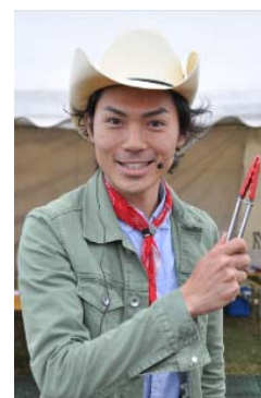
たけだバーベキュー