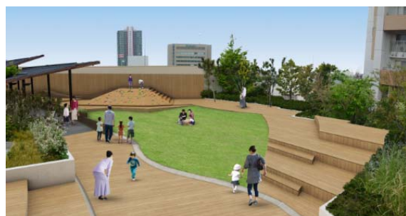
はらっぱ広場 (イメージ)

また、なんばパークスをイメージした世界で唯一の品種「なんばパークスオリジナルローズ」の花壇を設置するほか、樹木・植物の植替えを実施します。