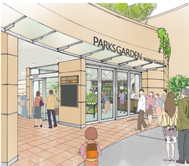
店舗正面（イメージ）