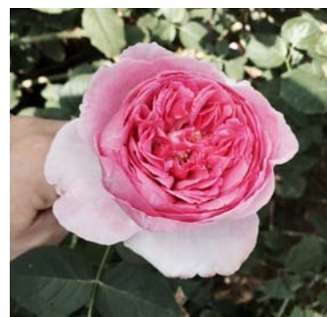
オリジナルローズ

また、なんばパークスのリニューアルオープンを記念して、期間・数量限定でオリジナルローズのプレゼントキャンペーンを実施します。