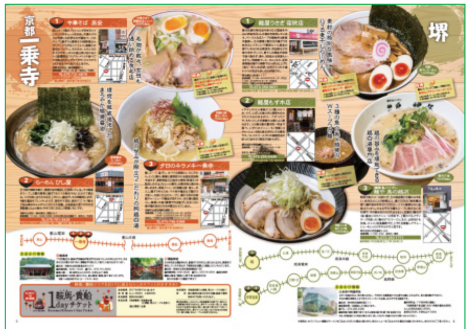
パンフレット3、4ページ（イメージ）