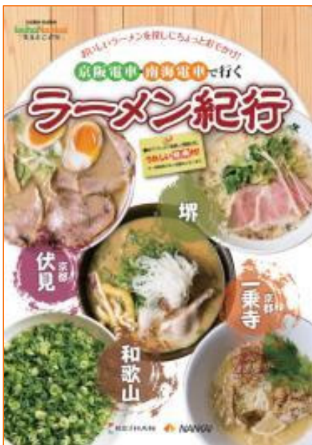
パンフレット表紙（イメージ）

ぜひ、パンフレットを片手に両社沿線へ足をお運びいただき、絶品ラーメンをご堪能ください。詳細は別紙のとおりです。