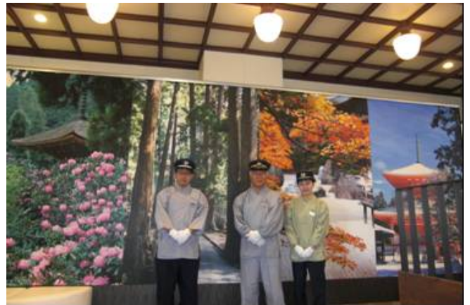
作務衣姿の駅係員