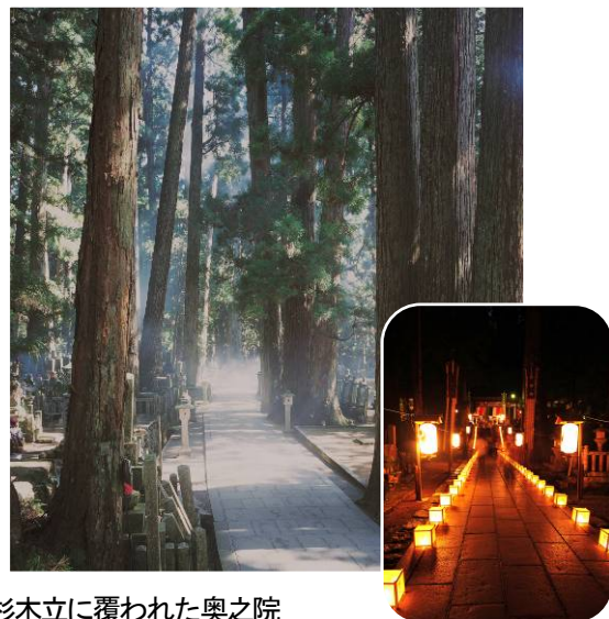
杉木立に覆われた奥之院

標高約900mの高野山は、8月の平均気温が大阪よりも約5℃低く、避暑地として最適です。高野山の涼しい空気と豊かな自然を満喫しにお出かけください。