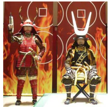
「真田幸村公」「真田昌幸公」の甲冑