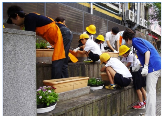
昨年の花の植え替えの様子（昨年9月撮影）