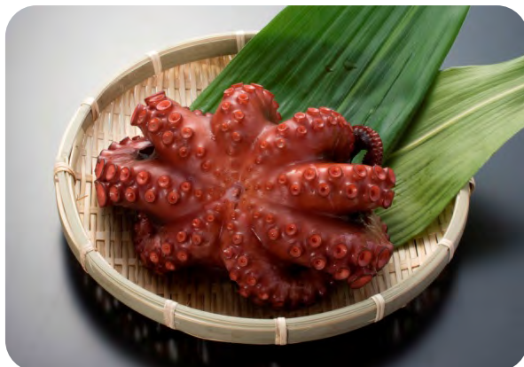
【南海】田尻のうまいもん・泉だこ