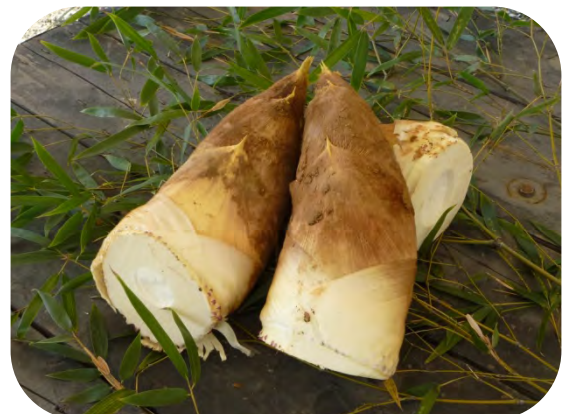
【京阪】八幡のうまいもん・たけのこ