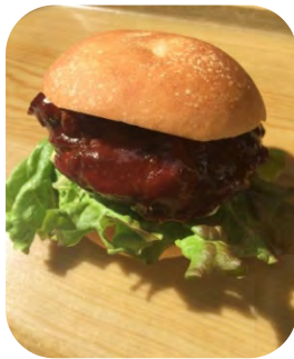
たけのこバーガー

八幡産・山城産のたけのこ、新鮮な野菜や紅茶のほか、たけのこご飯やたけのこバーガーを販売します。