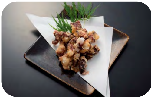
たこの唐揚げ (イベント限定)