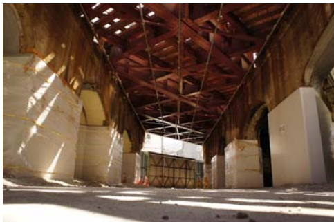
開発前（平成24年撮影）

高架梁の美しいアーチなど、78年前に竣工した鉄道高架構造物が持つ重厚な風合いと、長年倉庫や事務所として利用されてきた「産業感」のある雰囲気を生かして、店舗づくりを行います。（※第3期エリアの一部は昭和49年、昭和55年竣工）