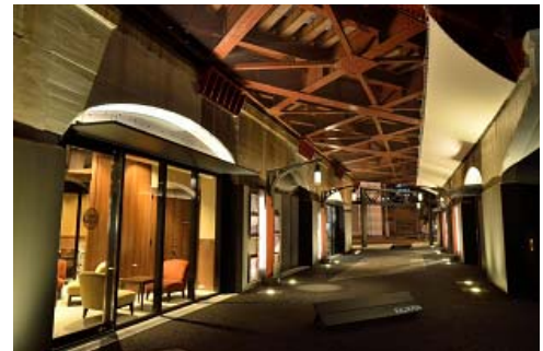
開発後（平成27年撮影）