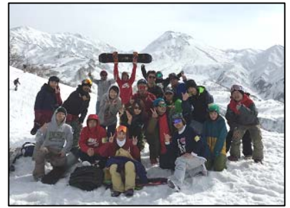
交流イベントの様子

第1期・第2期エリアでは、自転車ツアーやDIYワークショップ、スノーボードツアーなどを随時開催することで、店舗とお客さまのみならず、お客さま同士が交流する場を提供しています。第3期エリアの3店舗でも、“つながり”を生み出す取り組みを実施します。