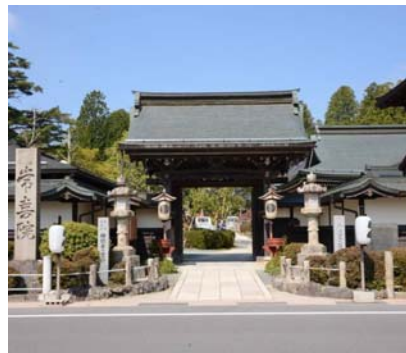
常喜院では、住職の法話をお聞きください