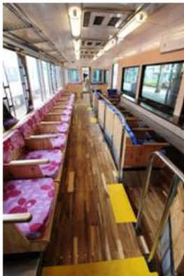
「天空」からの眺望を楽しみつつ、高野山へ