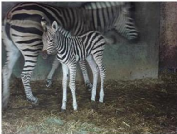
生後間もないシマウマの赤ちゃん