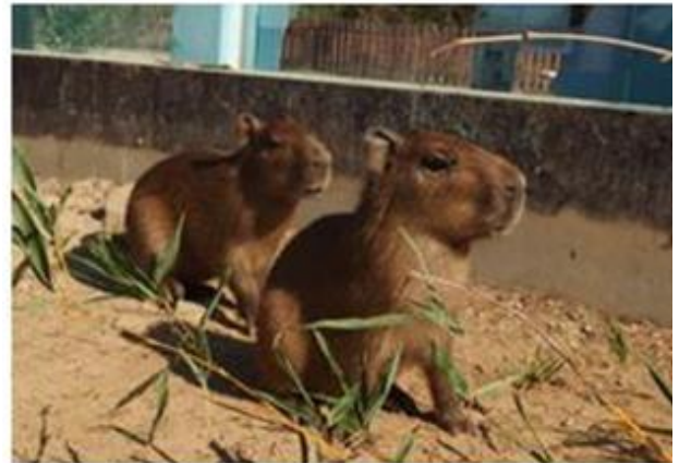
カピバラの双子の赤ちゃん