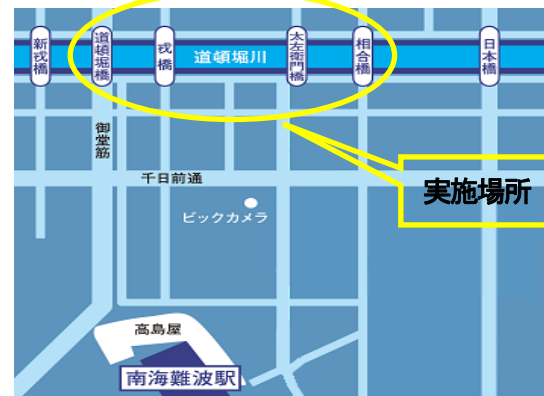
実施場所（とんぼりリバーウォーク）周辺地図

「水辺のファンタジー」は、「大阪・光の饗宴2015」のエリアプログラムである「まいどおおきに！大阪ミナミ光マッセ！」イルミネーションの一環です。