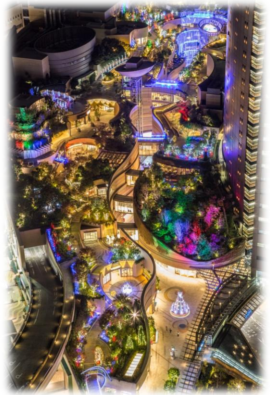
なんばパークスは「光の杜」に