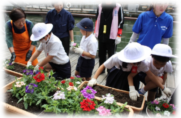
前回の花の植替えの様子（今年5月撮影）