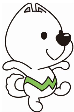
2015年 紀の国わかやま国体・紀の国わかやま大会 マスコット「きいちゃん」