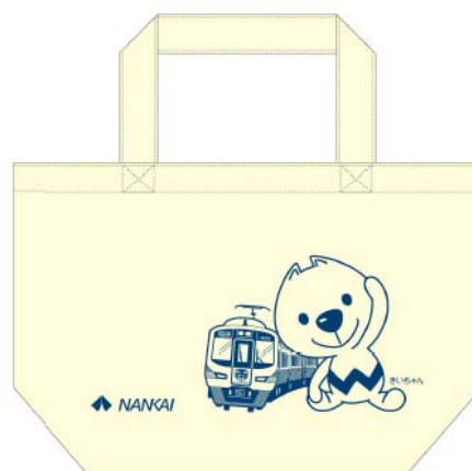
南海オリジナルのきいちゃんトートバッグを手に入れて