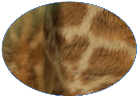
ハートマークが見つかるかな？