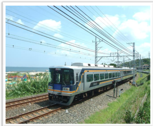
※特急サザンの画像はイメージです