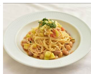
「四種豆とフレッシュトマトのカッペリーニ」 自由ヶ丘グリル

一度に4種類の豆が楽しめる「四種の豆の抹茶かき氷」や、高野山名産の胡麻豆腐を使った「黒豆の胡麻豆腐をつかった豆乳のかき氷」など、夏にぴったりのひんやり精進スイーツや、ヘルシーな米粉を使った「米粉豆乳パンケーキ」など、精進スイーツが全11種類登場します。