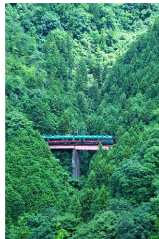
涼やかな夏の高野山への旅路

金剛峯寺や霊宝館の拝観券など、高野山現地 6 か所 5500 円以上の特典付きクーポンブックを先着 3000 名様にプレゼントします。秘仏公開のある今秋の高野山旅行でご利用ください。