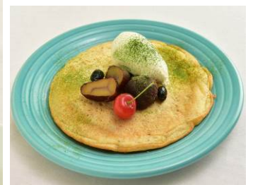
「米粉豆乳パンケーキ」 HENRY GOOD SEVEN