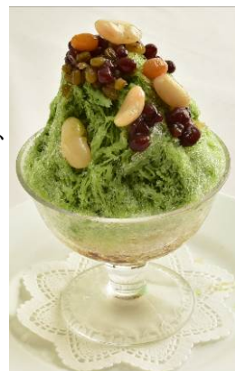
「四種の豆の抹茶かき氷」 SO TIRED