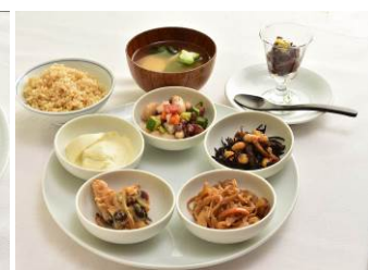
「豆 五法御膳」 mus mus