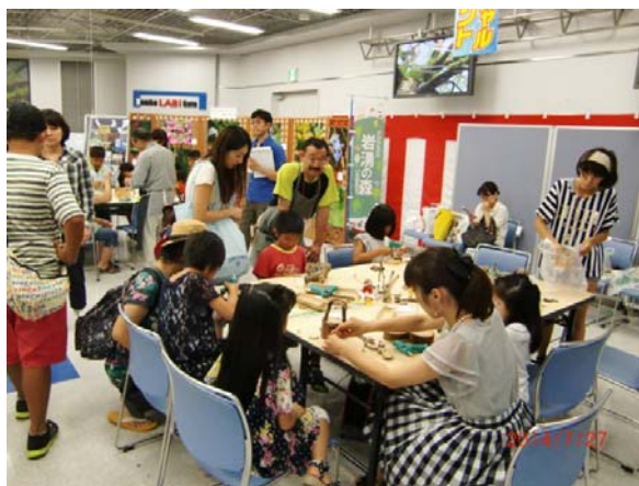
昨年エコワークショップの様子