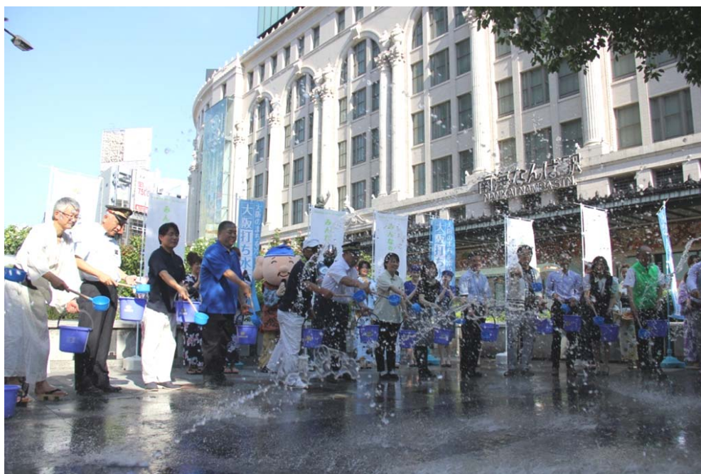
昨年の「打ち水セレモニー」の様子