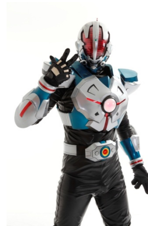
日本橋のご当地ヒーロー 「地球戦士ゼロス」