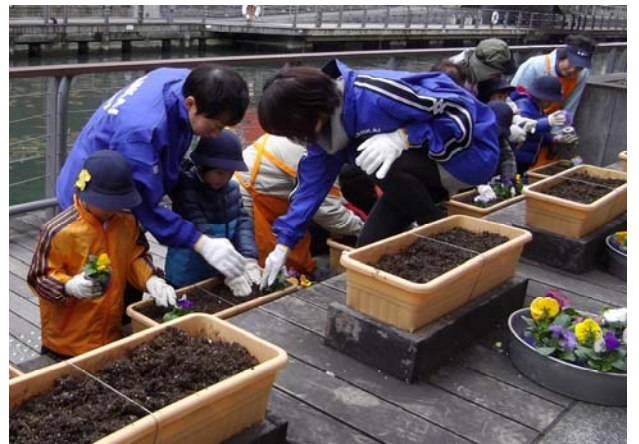
前回の花の植替えの様子（昨年12月撮影）