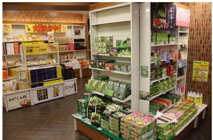
外国人に人気の抹茶菓子も多数ラインナップ