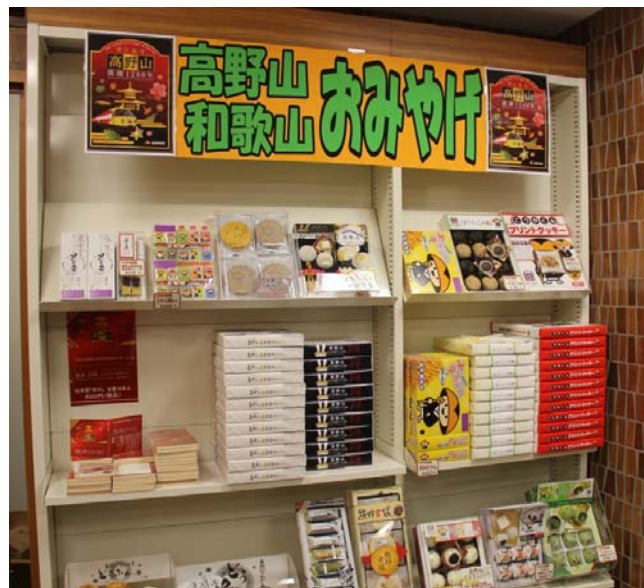
↑高野山や和歌山で人気のお土産をそろえた区画 ←店の外観は多言語で標記