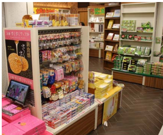
鉄道グッズも取り扱っています