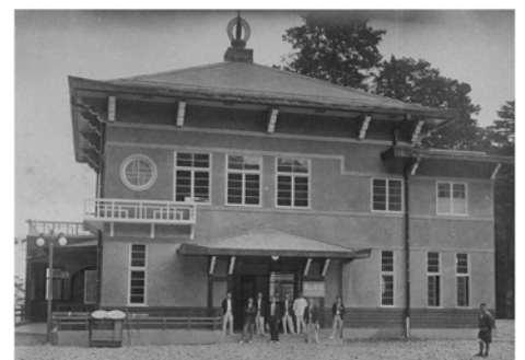
開業間近の高野山駅 （中西研二 編著「ケーブルカー」より）