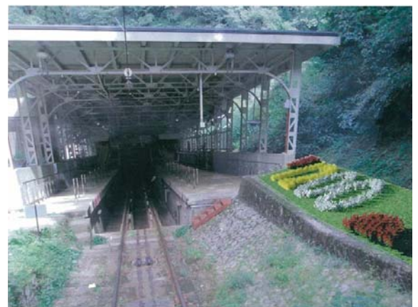
極楽橋駅の花文字花壇 (イメージ)