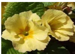
プリムラポリアンサ（イメージ）