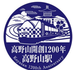
高野山開創1200年 記念スタンプ(イメージ)

参拝者がお堂に入る時や、修行者が身を清めるために用いる数種類の香木を混ぜて粉末にした塗るお香です。高野山駅でも、高野山にお越しのお客さまにお使いいただけるように塗香を設置します。