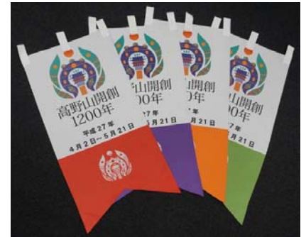
4色のタペストリー (イメージ)

高野線と鋼索線(ケーブルカー)の乗り換え駅である「極楽橋駅」では、平成26年8月から27年2月まで美装化工事を行い、コンコースおよび連絡通路の壁面・床・天井を塗装しました。また、ホームの一部、コンコースおよび連絡通路に行燈(あんどん)型の照明器具を配置しました。