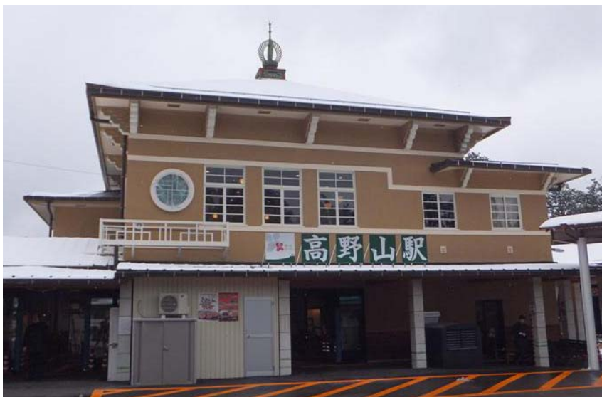
リニューアルした高野山駅（外観） ～開業当時の意匠に近づけました～

高野山は弘法大師空海によって816年に真言密教の道場として開かれ、平成27年に開創1200年を迎えます。これを記念して4月2日（木）から5月21日（木）までの50日間、大法会が執り行われます。