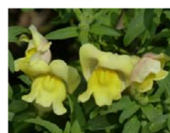
キンギョソウ（イメージ）