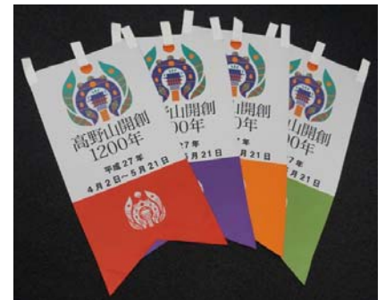
4色のタペストリー (イメージ)

高野線と鋼索線（ケーブルカー）の乗り換え駅である「極楽橋駅」では、平成26年8月から27年2月まで美装化工事を行い、コンコースおよび連絡通路の壁面・床・天井を塗装しました。また、ホームの一部、コンコースおよび連絡通路に行燈（あんどん）型の照明器具を配置しました。