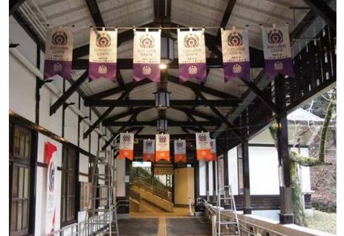
連絡通路でのタペストリー装飾 (イメージ)

高野山開創1200年を記念した大提灯（直径60cm、長さ162cm）1個を設置します。