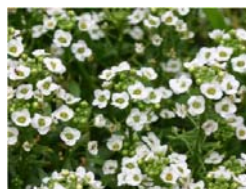
アリッサム（イメージ）