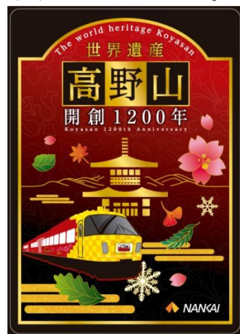
高野山開創1200年 ステッカー （縦35cm×横25cm）