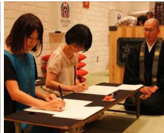
写経体験(イメージ)