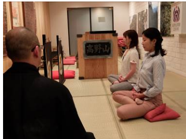
阿字観体験(イメージ)