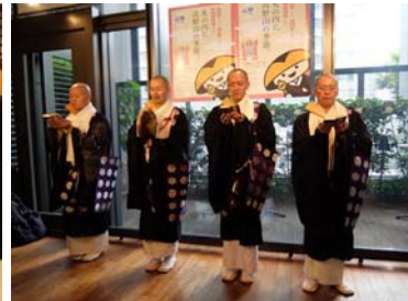
声明ライブ(イメージ)