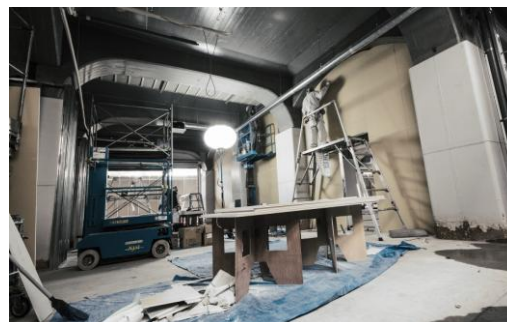
<リノベーション工事中>