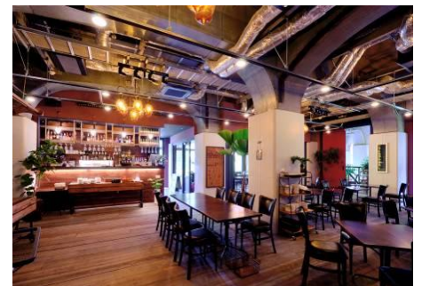
<リノベーション後>