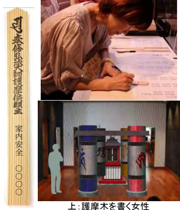
上：護摩木を書く女性 下：願かけ堂(装飾はイメージ) 左：護摩木

護摩とは、供物(護摩木・五穀など)を炎に投じて神仏を供養する修法のことで、火の神が煙とともに供物を天上の仏様に届けて願い事をかなえるという密教にのみ存在する修法の一つです。ライブラリーで僧侶から直接護摩木を受け取って祈願を書いていただけます。預けられた護摩木たちは、僧侶達が高野山に持ち帰りお焚き上げしていただきます。 ※祈願料：1本 500円 (お札をお渡します)