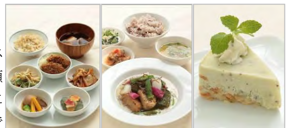
「五法御膳」 mus mus

「丸の内ハウス」内のレストラン全9店舗で、オリジナルの精進スイーツや精進料理が登場します。今年の注目は、精進料理に欠かせないお麩を使ったメニュー。揚げ麩をビスケット代わりに敷き詰めたヨーグルトケーキや、一度に6種類のお麩が楽しめる御膳など、伝統の精進料理を丸の内流にアレンジしました。見て驚き、食べて満足のおいしい修行ができます。