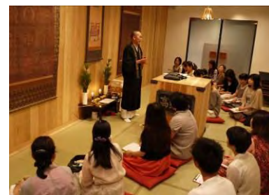
昨年の高野山夜学校の様子

高野山にまつわる様々なテーマを深く学べる「高野山夜学校」が今年も開講。目玉は、来年高野山で行われる記念行事などをわかりやすく解説した“高野山開創 1200 年記念大法会”、や“熊野三山曼荼羅絵解き”があります。日替わりで金剛峯寺の僧侶他から、テーマに合わせた高野山の講座を学べます。