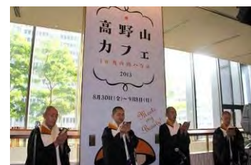
昨年の声明ライブの様子

また、共有エリア「ライブラリー」では、1 時間ごとの交代制で「写経」を体験できます。僧侶から心得や写経の仕方などの指導を受けることができ、完成した写経は持ち帰るか高野山総本山金剛峯寺への奉納(奉納料 1,000 円)もできます。