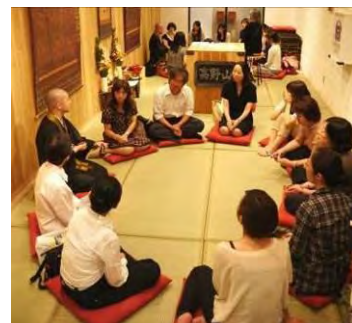
昨年の「僧侶と語らナイト」の様子