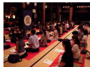
阿字観の様子(会場は異なります)

阿字観とは、真言宗の瞑想法の一つで、精神の集中力と想像力を養い、人間の潜在能力を呼び覚ますと言われていています。今回は、高野山の僧侶が、呼吸法からわかりやすく指導するので、初めての方でも安心して体験いただけます。自身の内面と向き合うことで、普段とは一味違った非日常を体験することができます。