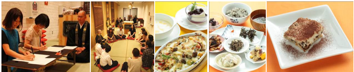
左2枚:体験コンテンツの様子 / 右3枚:昨年のオリジナル精進メニューの一部

体験コンテンツの内容や、高野山カフェ関連イベントの今後の開催予定については、詳細を随時発表してまいります。