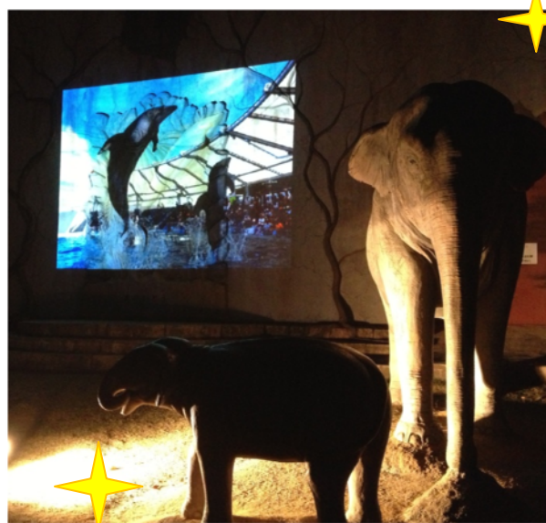
メモリアル資料館の壁面に映像を投影