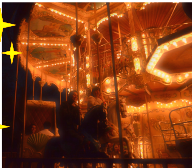
ライトアップでロマンチックな園内