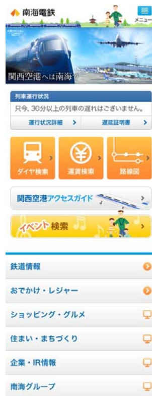
スマートフォンからの 画面イメージ

今回のリニューアルによって、スマートフォンの画面サイズに合った最適なページレイアウトでご覧いただけるようになりました。よく使う情報を中心に見やすく配置しており、通勤・通学時をはじめ、外出中や空き時間でも、電車の運行状況やイベントなどを快適にお調べいただけます。