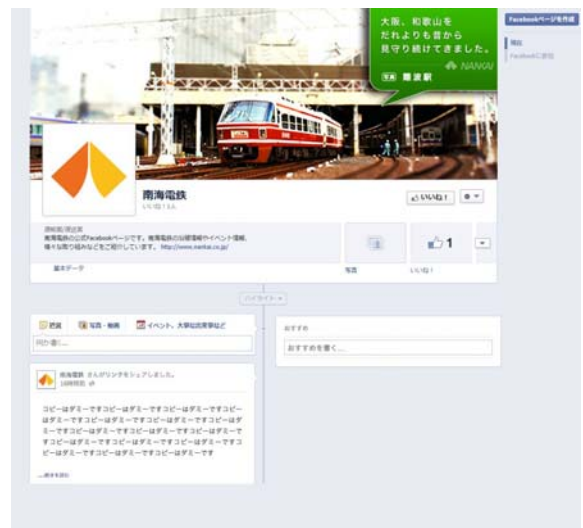
フェイスブックページ