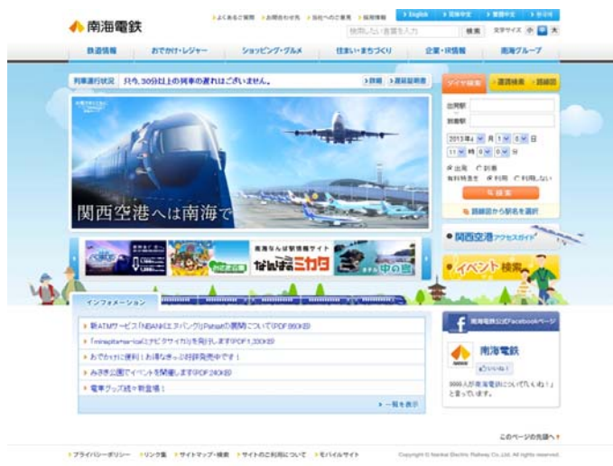
南海電鉄オフィシャルサイト