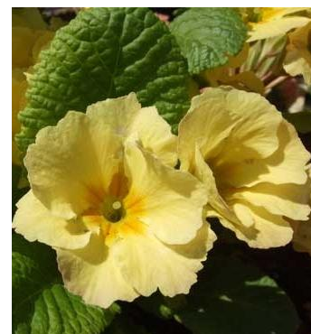
プリムラポリアンサ