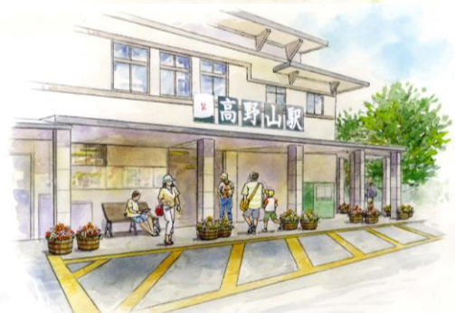
平成27年4月の極楽橋駅付近（上）と高野山駅周辺（イメージ）