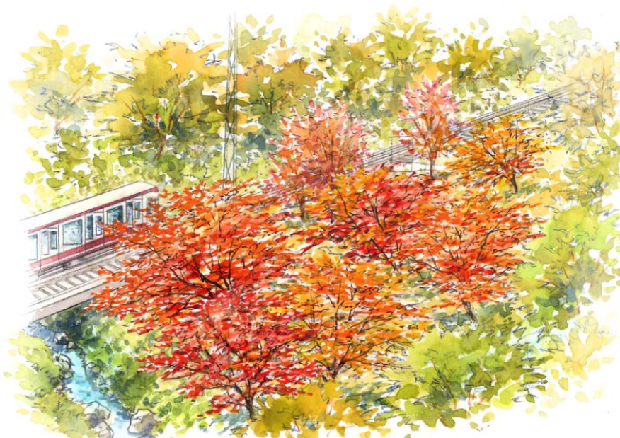
十数年後のケーブルカー沿いの風景（イメージ）