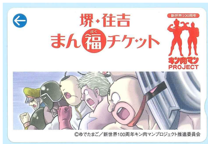
「堺・住吉まん福チケッ ぶく ト」の券面デザイン

チケット有効区間の沿線にあり昨年100周年を迎えた新世界をPRするため、新世界100周年キン肉マンプロジェクト推進委員会と連携し、「新世界キン肉マンプロジェクト」のイメージキャラクターである人気漫画「キン肉マン」を、昨年に引き続き同チケット(カード式乗車券)の券面にデザインしました。