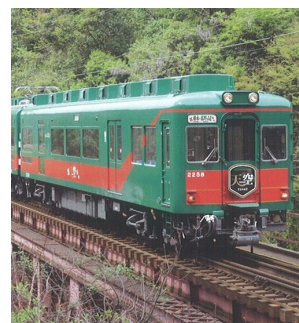
展望デッキ付きの こうや花鉄道「天空」

プチ修行体験の合間には、実際の現地高野山の見どころや、情報をスライドショーでご紹介。高野山僧侶や現地に詳しいツアーコンダクターより、現地へのアクセスや高野山の知られざるスポットに体験コンテンツ、山内に多数ある宿坊それぞれの魅力や楽しみ方などをご紹介します。