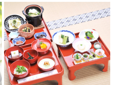
一乗院の精進料理(一例)