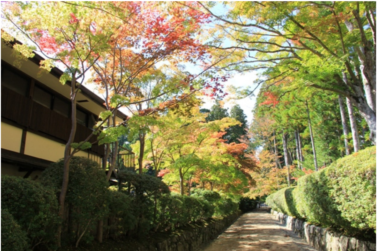
「蛇腹道（じゃばらみち）」では紅葉のトンネルが楽しめます（10月19日撮影）

「紀伊山地の霊場と参詣道」として、世界遺産に登録されている和歌山県・高野山では、モミジやイチョウが赤や黄色に色づき始めました。山内の街並みや宿坊寺院の境内が色鮮やかに彩られています。高野山の紅葉の見頃は、例年10月下旬から11月初旬です（気象条件によって変化します）。