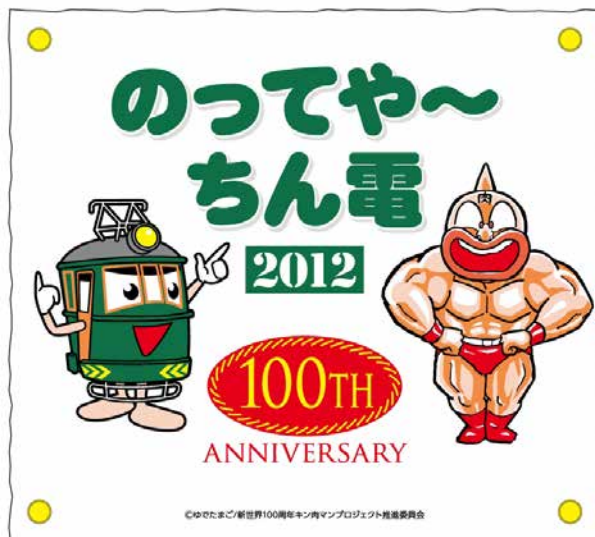
キャンペーンロゴ