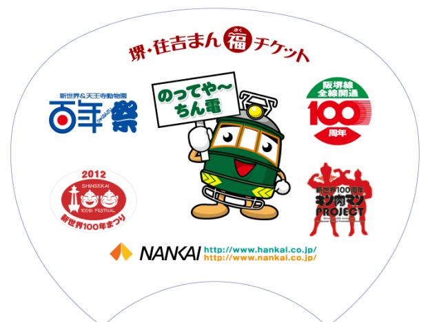
オリジナルうちわデザイン