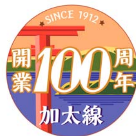
記念ヘッドマークのデザイン

※「加太駅100周年記念事業実行委員会」は、和歌山市、加太活性化協議会、加太観光協会、南海電鉄で構成しています。