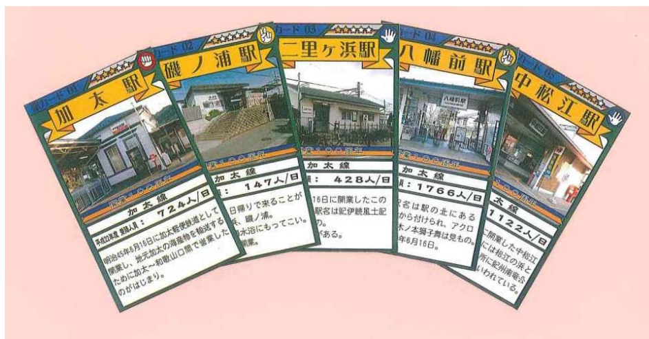
オリジナルカード