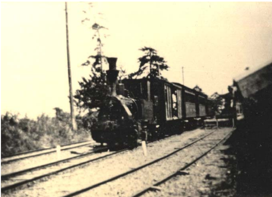
加太軽便鉄道時代の加太駅