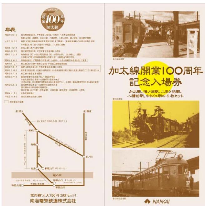
記念入場券のパンフレット(表 面)