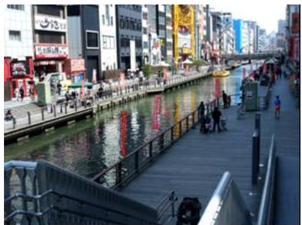
とんぼりリバーウォーク（戎橋・太左衛門橋間）