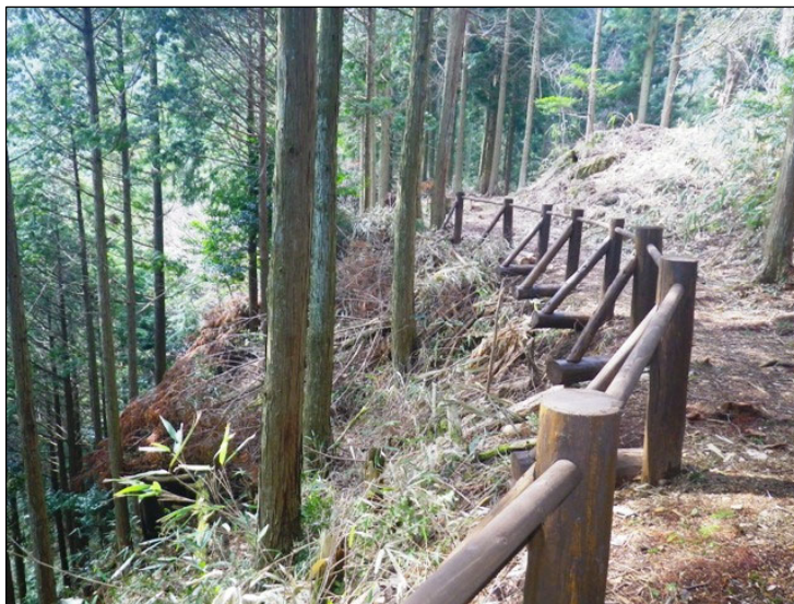
復元された不動坂旧ルート