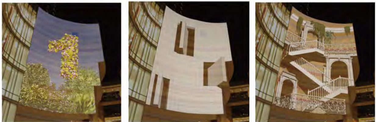
映像アート『Break of Spring』イメージ