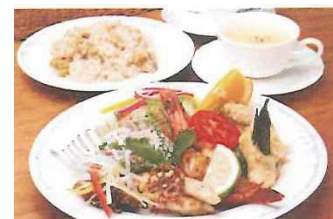
「カフェ&レストラン歩絵夢」でのランチ(イメージ)