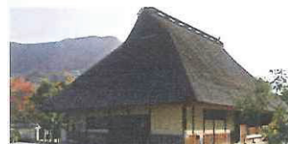
滝畑ふるさと文化財の森センター