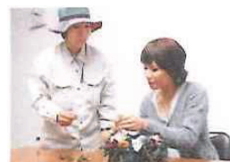
大阪府立花の文化園での クリスマスリースづくり