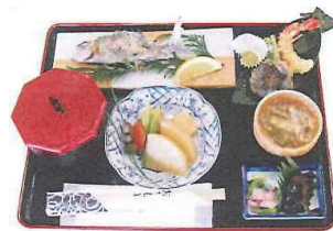
滝畑湖畔でのランチ(イメージ)