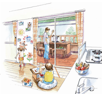
屋外グリルで見せる父親の背中