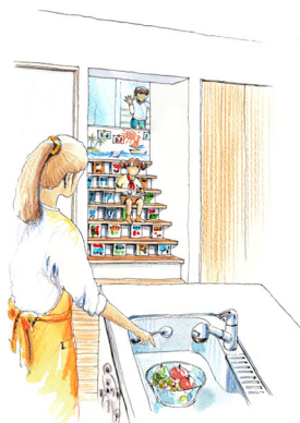
本棚を兼ねた階段で勉強する子ども