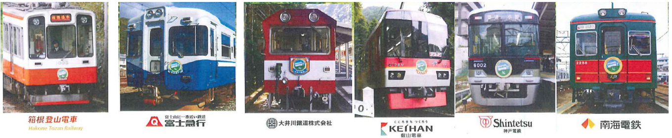
昨年1周年を記念してヘッドマークを掲出した6社の車両