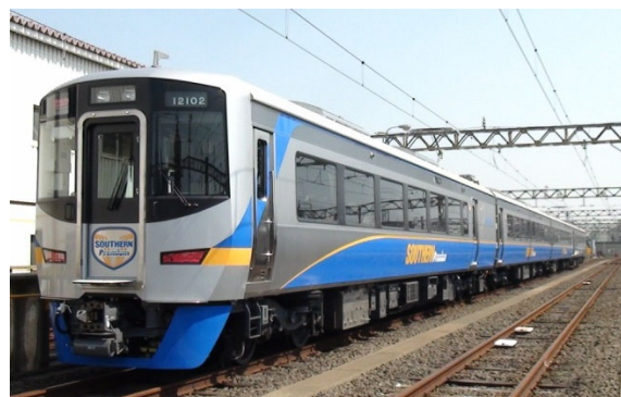
特急「サザン」新型車両12000系

当社では、これらのイベントを鉄道ファンはもちろん、ご家族の皆さまにも楽しんでいただくことで、営業運転開始後も親しみを持って同車両をご利用いただきたいと思います。